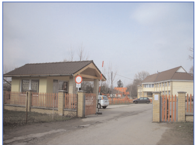
Megépült az iskolai portásfülke.