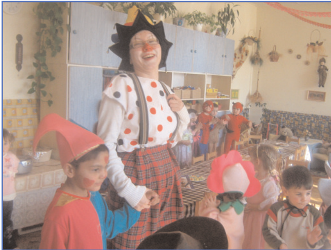
Vigasság, tánc, az ovisok farsangolmak.