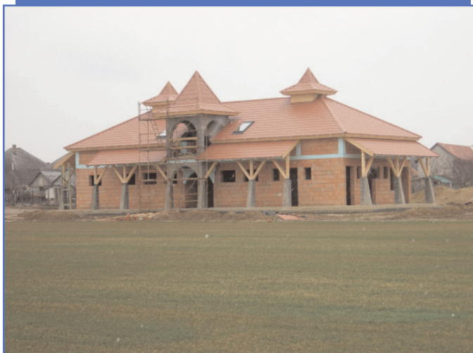
Épül az új sportöltöző!