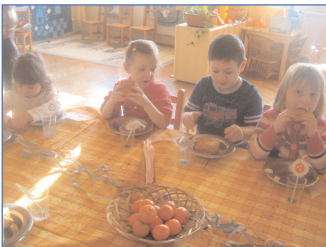
A sok móka és játék után jól esik a ennivaló.