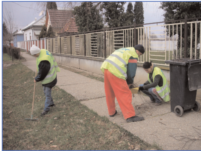
Takarítás, karbantartás és más a városunk számára fontos munkát végeznek az "Út a munkához" programhoz csatlakozott Mándoki lakosok.

Fontos alapelv, hogy aki képes dolgozni, az munkával járjon hozzá a közteherviseléshez, továbbá együttesen érvényesüljön a társadalmi szolidaritás és az egyéni felelősség, azonban a minimum szintű ellátást biztosítani szükséges az arra rászorulóknak.