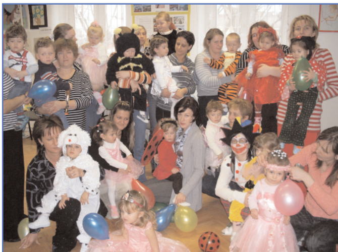
A zenebölcsi farsang!